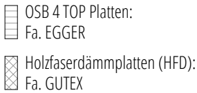
Aufbau Außenwand s. Detail AwGrund